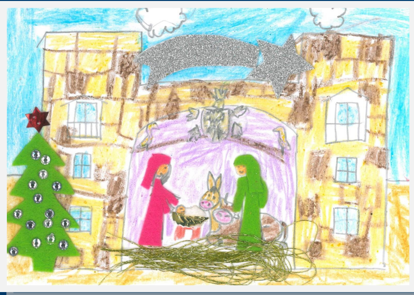
1 er PREMIO DEL CONCURSO DE POSTALES NAVIDEÑAS DEL 2018 AIMAR BARANDA VILLATE