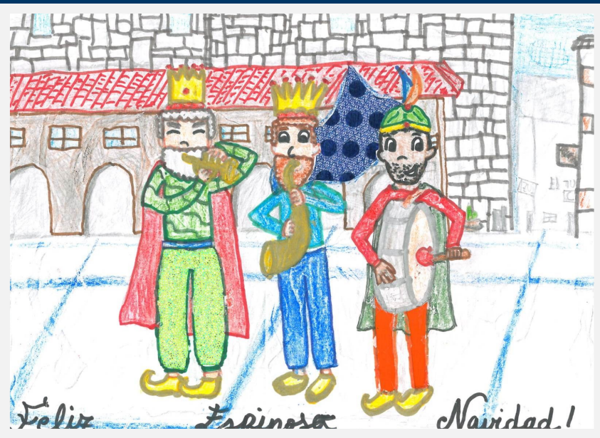
2 o PREMIO DEL CONCURSO DE POSTALES NAVIDEÑAS DEL 2018 VEGA MARTÍNEZ-ABASCAL DE AYMERICH